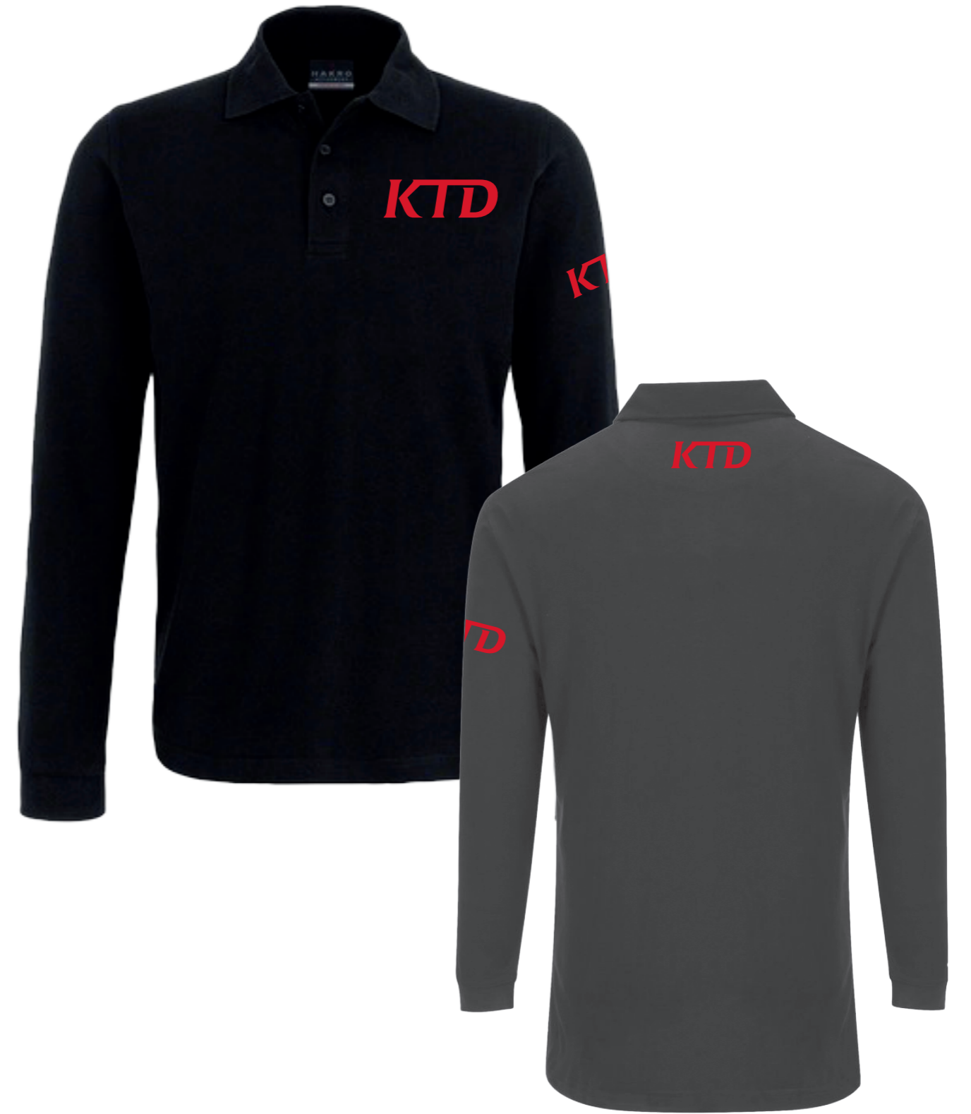
POLO MANCHES LONGUES