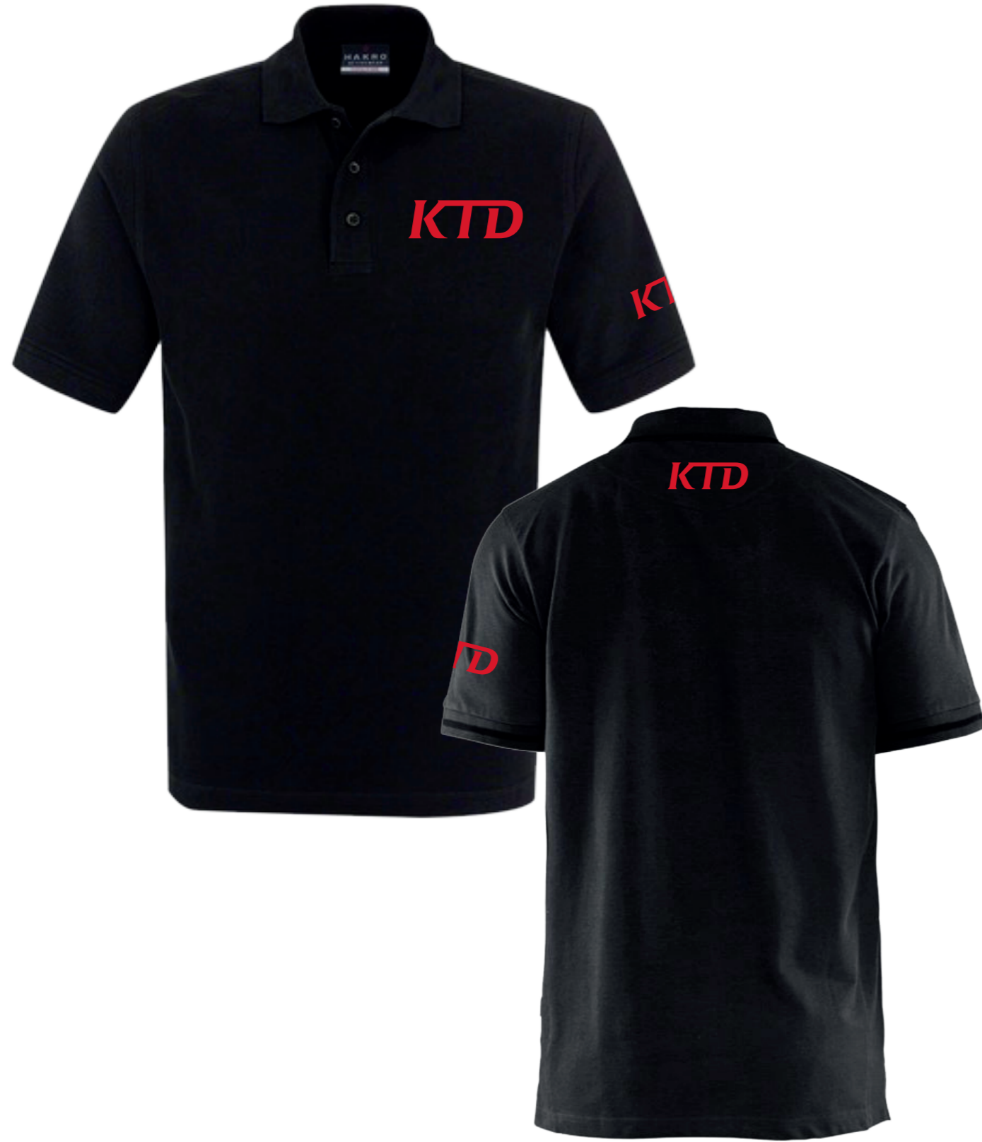
POLO MANCHES COURTES